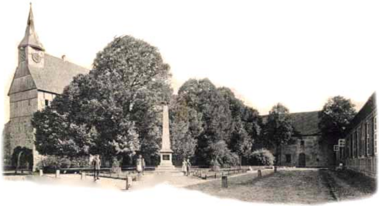
Grusse aus Zarrentin am Schaalsee